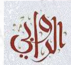
شركة إنماء الروابي للمقاولات